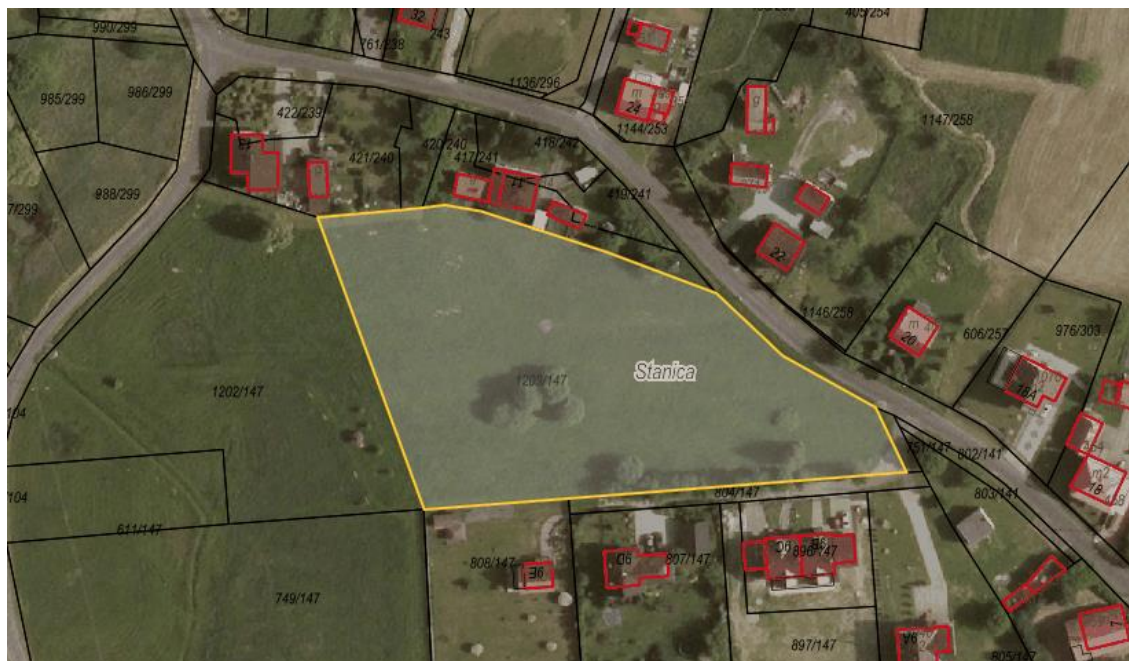
Rysunek 1 Działka nr 1203/147 zaznaczona kolorem żółtym