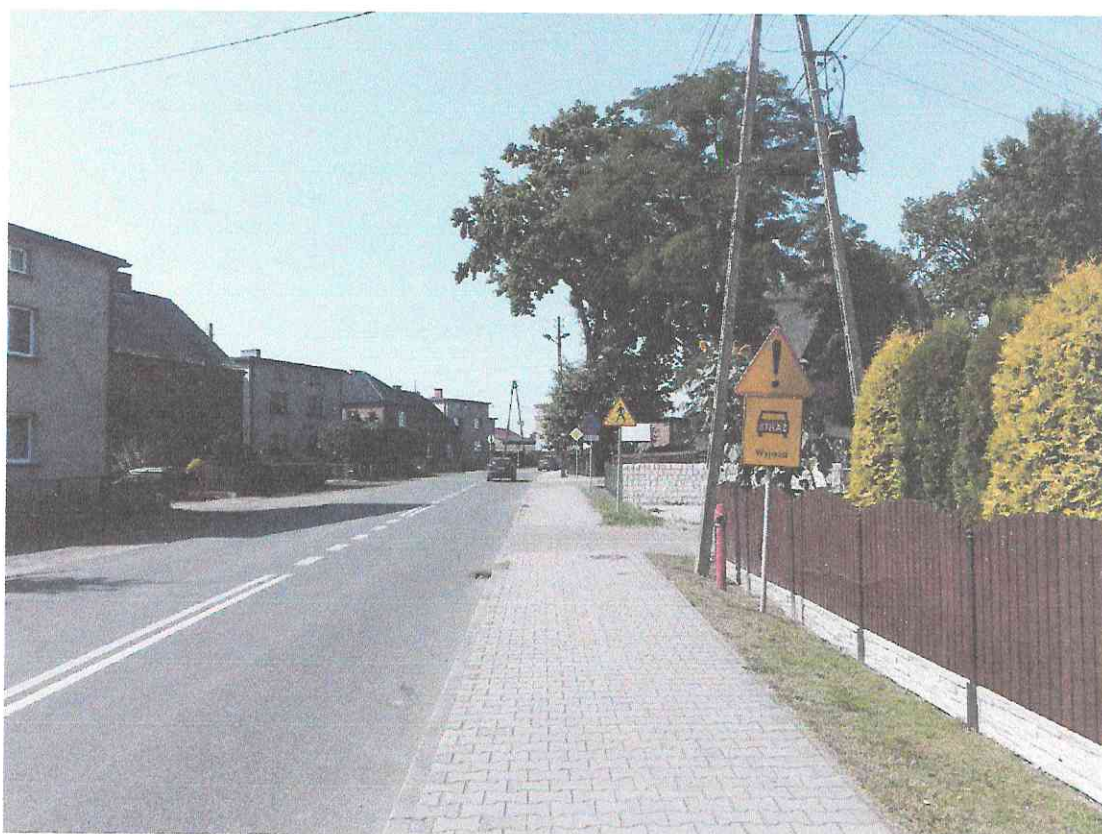
Zdjęcie nr 2 – Aktualne znaki ostrzegające