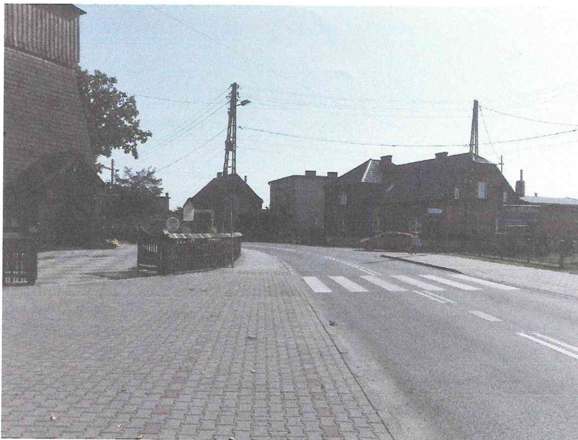
Zdjęcie nr 1 – Widok z samochodu bojowego podczas włączania się do ruchu na drogę powiatową 2930S