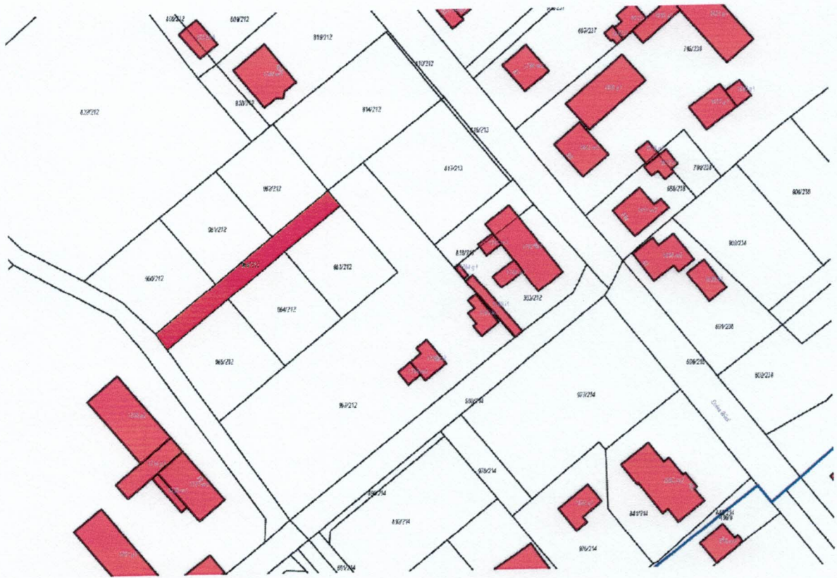
Pilchowice dz. nr 966/212