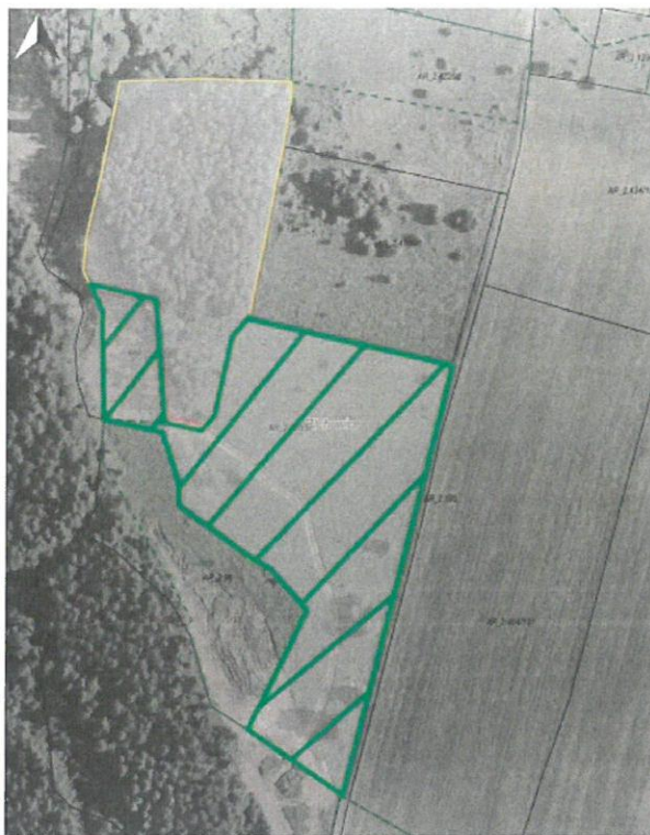
Rys. nr 1 Obszar przeznaczony do dzierżawy oznaczono kolorem zielonym

Zgodnie z danymi ujawnionymi w ewidencji gruntów i budynków, na powierzchnię części działki przeznaczonej do dzierżawy składają się następujące użytki: