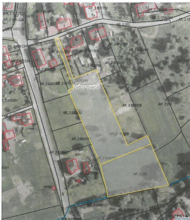
Rys. nr 1 Obszar przeznaczony do dzierżawy oznaczono kolorem żółtym

Zgodnie z danymi ujawnionymi w ewidencji gruntów i budynków, na powierzchnię działek przeznaczonych do dzierżawy składają się następujące użytki: