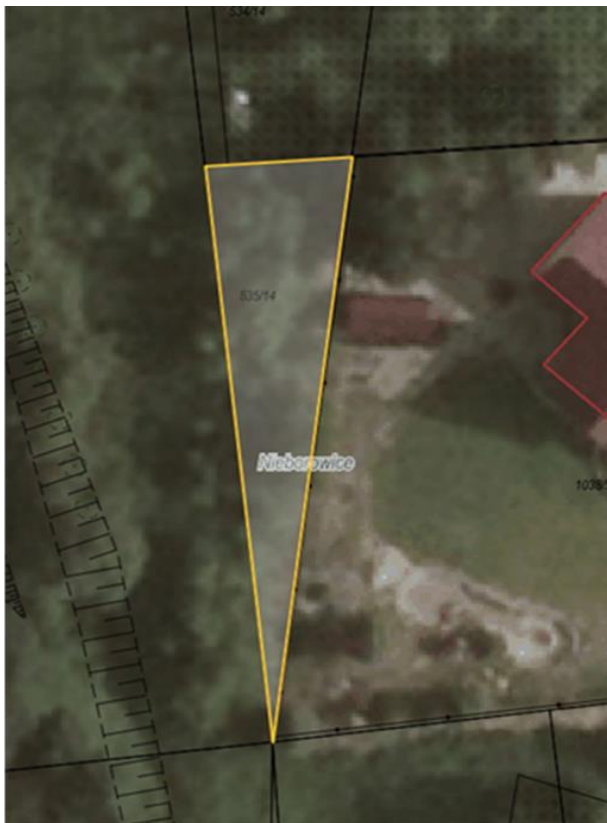
Rysunek 1. Działka nr 535/14 przeznaczona do sprzedaży zaznaczona kolorem żółtym

Dla przedmiotowej działki objętej sprzedażą nie wykonano badań geotechnicznych, ani badań stopnia zanieczyszczenia gleby. Zatem sprzedawca nie ponosi odpowiedzialności za ewentualne negatywne skutki wyników tych badań.