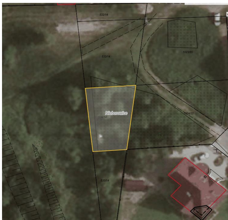
Rysunek 1. Działka nr 534/14 przeznaczona do sprzedaży zaznaczona kolorem żółtym.

Dla przedmiotowej działki objętej sprzedażą nie wykonano badań geotechnicznych, ani badań stopnia zanieczyszczenia gleby. Zatem sprzedawca nie ponosi odpowiedzialności za ewentualne negatywne skutki wyników tych badań.