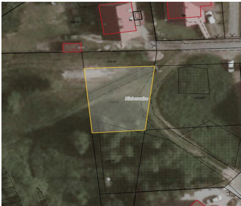
Rysunek 1. Działka nr 533/14 przeznaczona do sprzedaży zaznaczona kolorem żółtym.

Dla przedmiotowej działki objętej sprzedażą nie wykonano badań geotechnicznych, ani badań stopnia zanieczyszczenia gleby. Zatem sprzedawca nie ponosi odpowiedzialności za ewentualne negatywne skutki wyników tych badań.