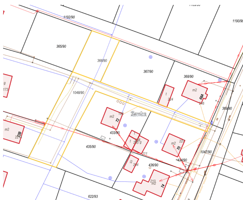
Rysunek 3 Fragment mapy z uzbrojeniem terenu

Działkę można zobaczyć w WEBEWID - Powiatowy System Informacji Przestrzennej: https://gliwicki.webewid.pl/e-uslugi/portal-mapowy oraz na stronach geoportal.gov.pl i mapy.geoportal.gov.pl .