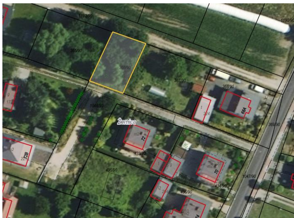
Rysunek 1 Działka przeznaczona do sprzedaży zaznaczona kolorem żółtym

Dla działki objętej sprzedażą oraz działki, na której ustanawiana będzie służebność nie wykonano badań geotechnicznych, ani badań stopnia zanieczyszczenia gleby. Zatem sprzedawca nie ponosi odpowiedzialności za ewentualne negatywne skutki wyników tych badań.