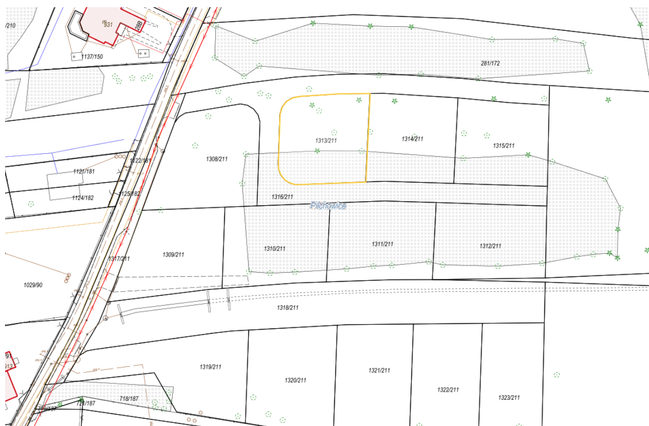
Rysunek 2 Fragment mapy z uzbrojeniem terenu