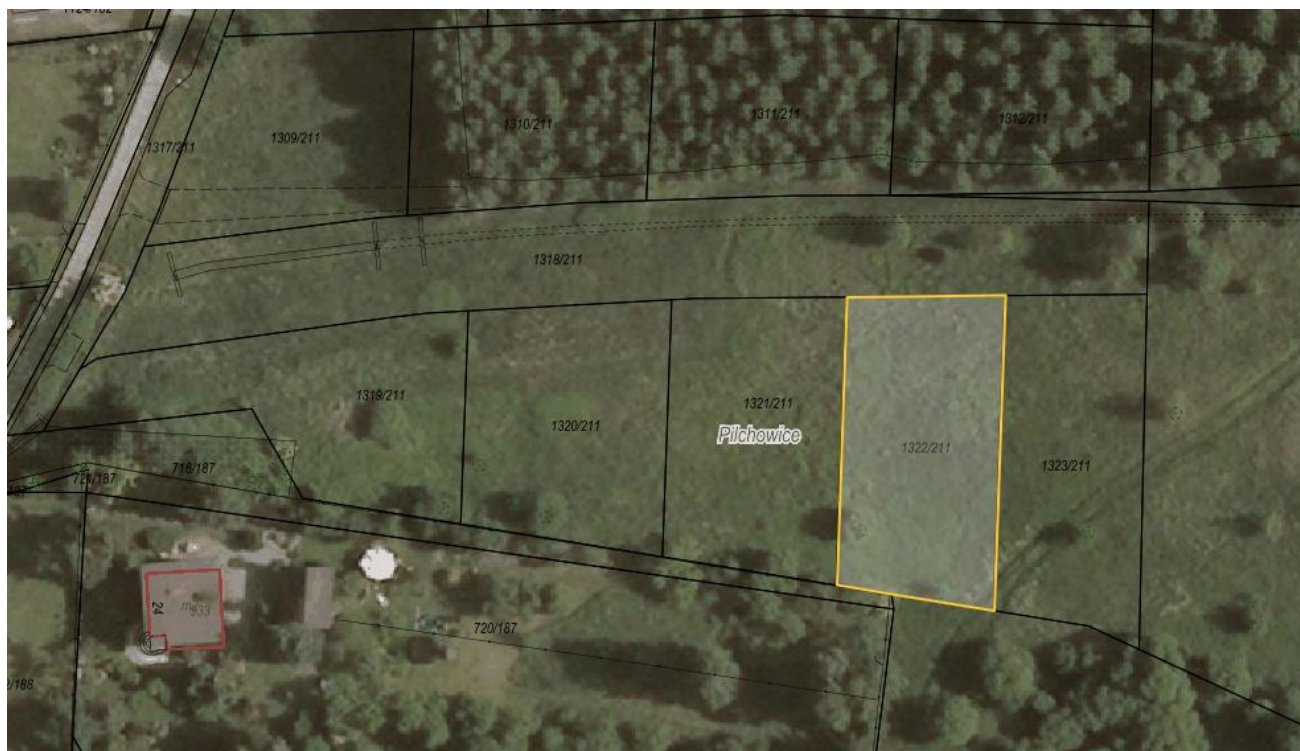
Rysunek 1 Działka nr 1322/211 przeznaczona do sprzedaży zaznaczona kolorem żółtym

Dla przedmiotowej działki objętej sprzedażą nie wykonano badań geotechnicznych, ani badań stopnia zanieczyszczenia gleby. Zatem sprzedawca nie ponosi odpowiedzialności za ewentualne negatywne skutki wyników tych badań.