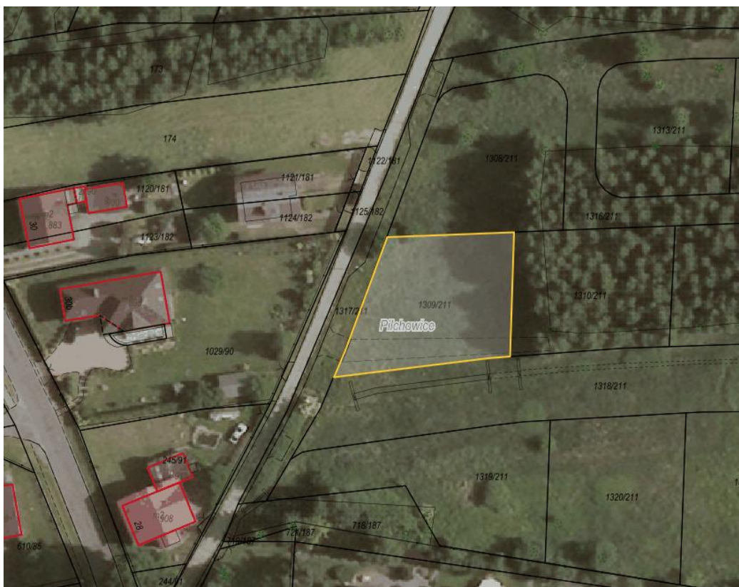
Rysunek 1 Działka nr 1309/211 przeznaczona do sprzedaży zaznaczona kolorem żółtym

Dla przedmiotowej działki objętej sprzedażą nie wykonano badań geotechnicznych, ani badań stopnia zanieczyszczenia gleby. Zatem sprzedawca nie ponosi odpowiedzialności za ewentualne negatywne skutki wyników tych badań.