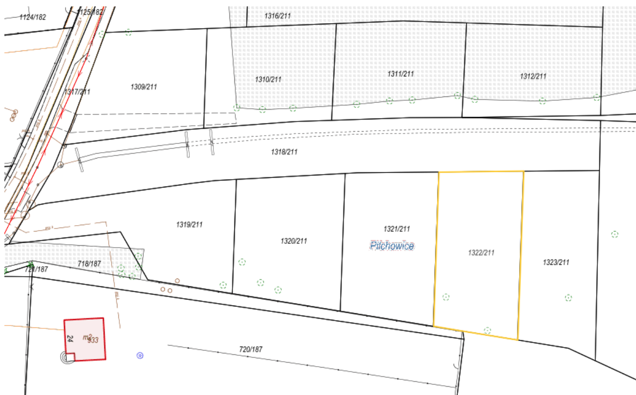
Rysunek 2 Fragment mapy z uzbrojeniem terenu

Działkę można zobaczyć w WEBEWID - Powiatowy System Informacji Przestrzennej: https://gliwicki.webewid.pl/e-uslugi/portaal-mapowy oraz na stronach geoportal.gov.pl i mapy.geoportal.gov.pl .