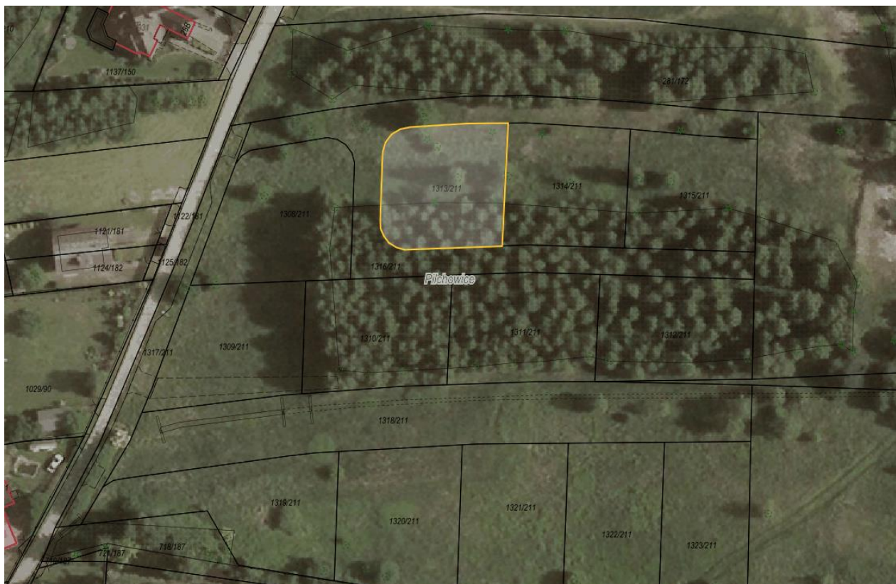
Rysunek 1 Działka nr 1313/211 przeznaczona do sprzedaży zaznaczona kolorem żółtym

Dla przedmiotowej działki objętej sprzedażą nie wykonano badań geotechnicznych, ani badań stopnia zanieczyszczenia gleby. Zatem sprzedawca nie ponosi odpowiedzialności za ewentualne negatywne skutki wyników tych badań.