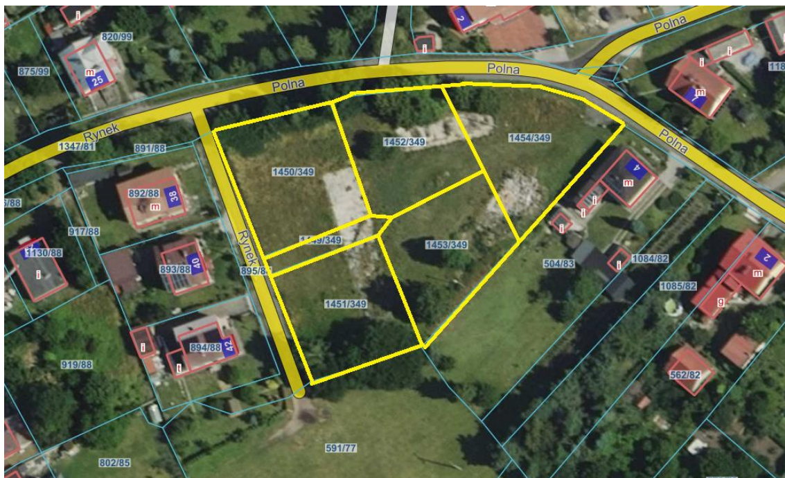
Rysunek 1 Działki nr 1449/349, 1450/349, 1451/349, 1452/349, 1453/349, 1454/349 obręb Pilchowice zaznaczona kolorem żółtym

Dla przedmiotowych działek objętych sprzedażą nie wykonano badań geotechnicznych, ani badań stopnia zanieczyszczenia gleby. Zatem sprzedawca nie ponosi odpowiedzialności za ewentualne negatywne skutki wyników tych badań.