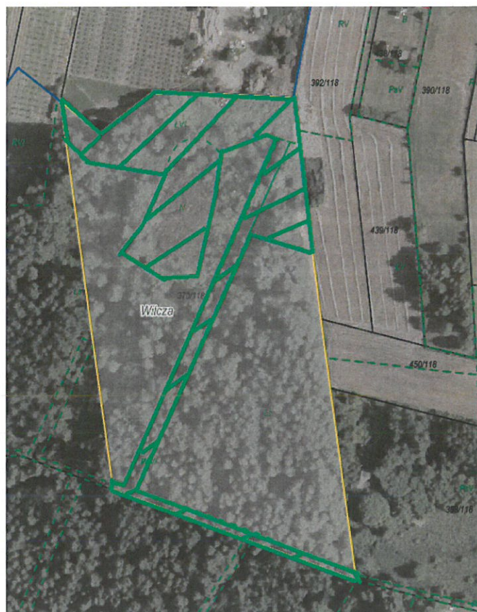
Rys. nr 2 Część działki ewidencyjnej nr: 370/118 ark. mapy 5 obręb Wilcza przeznaczona do dzierżawy oznaczona kolorem zielony