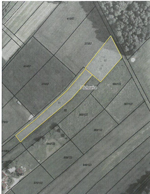
Rys. nr 1 Działki nr: 80 i 81 ark. mapy 15 obręb Pilchowice przeznaczone do dzierżawy oznaczono kolorem żółtym