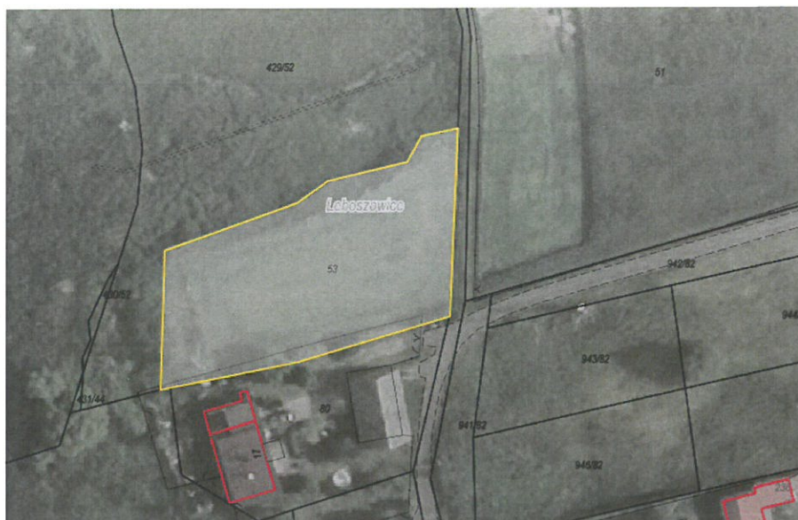
Rys. nr 1 Obszar przeznaczony do dzierżawy oznaczono kolorem żółtym

Zgodnie z danymi ujawnionymi w ewidencji gruntów i budynków, na powierzchnię działki przeznaczonej do dzierżawy składają się następujące użytki: