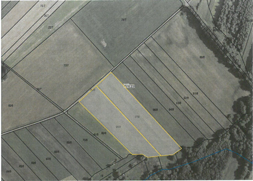
Rys. nr 1 Obszar dz. 97/8 i 98/8 przeznaczony do dzierżawy oznaczono kolorem żółtym