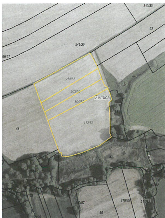
Rys. nr 1 Działki nr: 172/52, 278/52, 503/52, 504/52 obręb Żernica przeznaczone do dzierżawy oznaczono kolorem żółtym