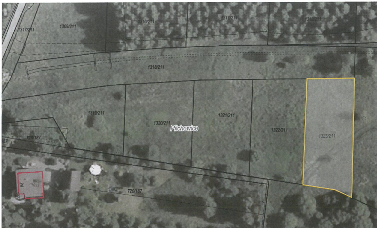
Rysunek 1 Działka nr 1323/211 przeznaczona do sprzedaży zaznaczona kolorem żółtym

Dla przedmiotowej działki objętej sprzedażą nie wykonano badań geotechnicznych, ani badań stopnia zanieczyszczenia gleby. Zatem sprzedawca nie ponosi odpowiedzialności za ewentualne negatywne skutki wyników tych badań.