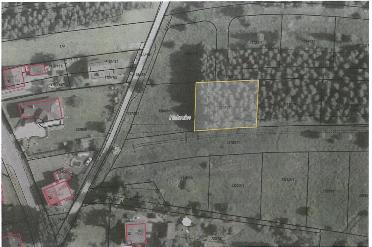
Rysunek 1 Działka nr 1310/211 przeznaczona do sprzedaży zaznaczona kolorem żółtym

Dla przedmiotowej działki objętej sprzedażą nie wykonano badań geotechnicznych, ani badań stopnia zanieczyszczenia gleby. Zatem sprzedawca nie ponosi odpowiedzialności za ewentualne negatywne skutki wyników tych badań.