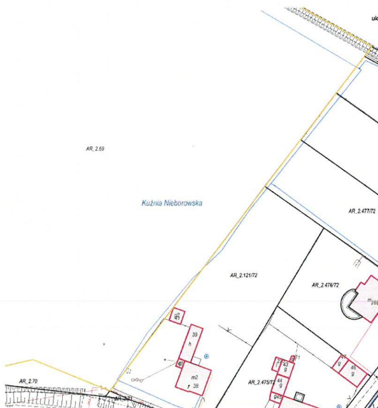
Rysunek 2 Fragment mapy z uzbrojeniem terenu