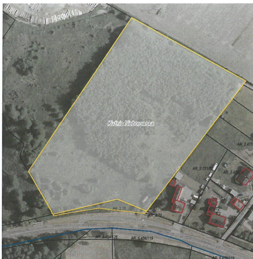
Rysunek 1 Działki przeznaczone do sprzedaży zaznaczona kolorem żółtym

Dla przedmiotowych działek objętych sprzedażą nie wykonano badań geotechnicznych, ani badań stopnia zanieczyszczenia gleby. Zatem sprzedawca nie ponosi odpowiedzialności za ewentualne negatywne skutki wyników tych badań.