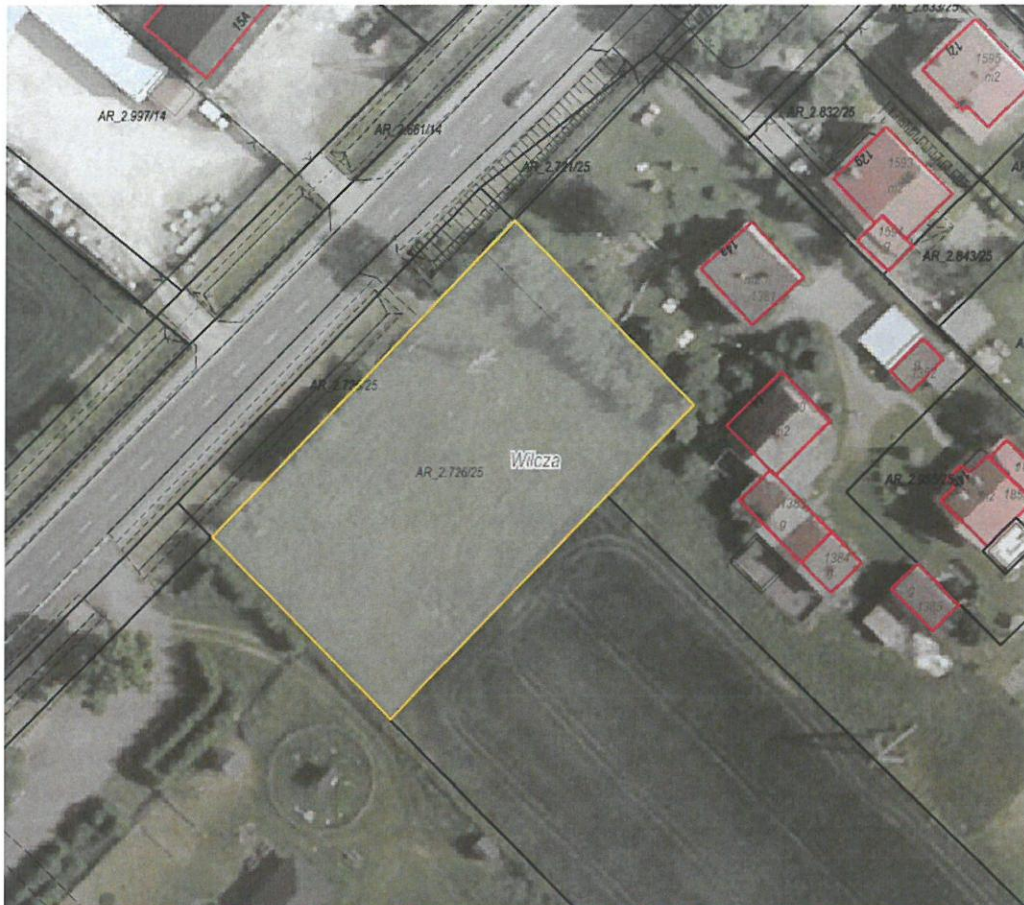
Rysunek 1 Działka przeznaczona do sprzedaży zaznaczona kolorem żółtym

Dla przedmiotowej działki objętej sprzedażą nie wykonano badań geotechnicznych, ani badań stopnia zanieczyszczenia gleby. Zatem sprzedawca nie ponosi odpowiedzialności za ewentualne negatywne skutki wyników tych badań.