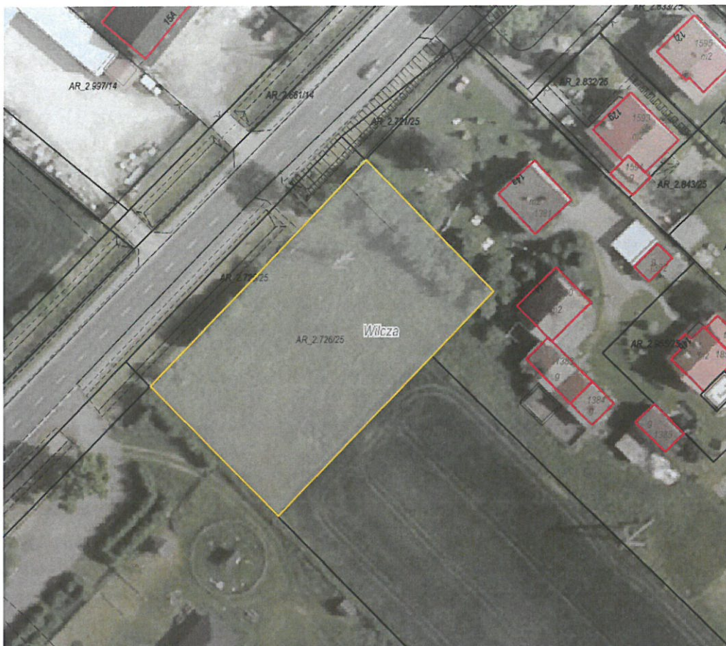
Rysunek 1 Działka przeznaczona do sprzedaży zaznaczona kolorem żółtym

Dla przedmiotowej działki objętej sprzedażą nie wykonano badań geotechnicznych, ani badań stopnia zanieczyszczenia gleby. Zatem sprzedawca nie ponosi odpowiedzialności za ewentualne negatywne skutki wyników tych badań.