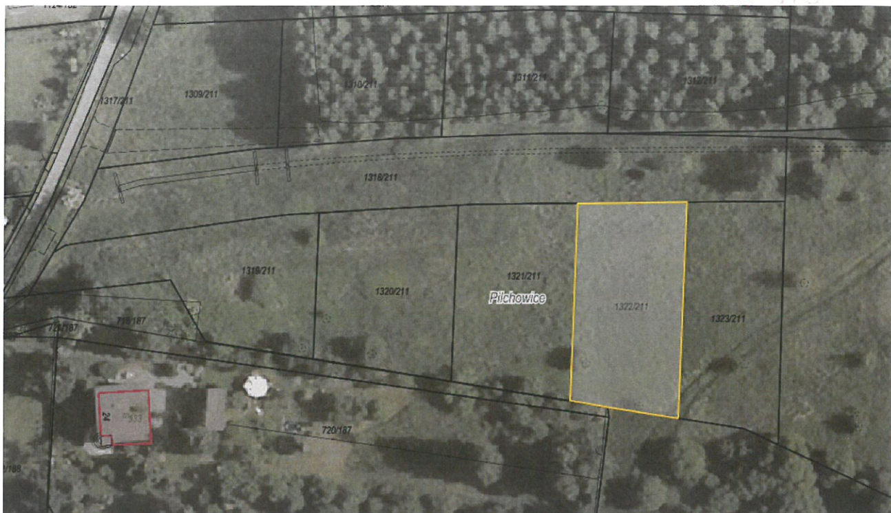
Rysunek 1 Działka nr 1322/211 przeznaczona do sprzedaży zaznaczona kolorem żółtym