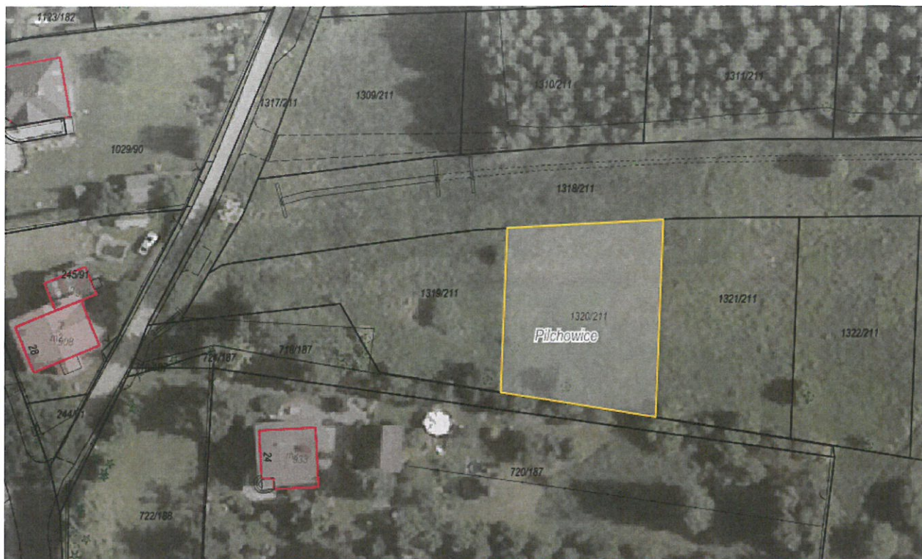
Rysunek 1 Działka nr 1320/211 przeznaczona do sprzedaży zaznaczona kolorem żółtym