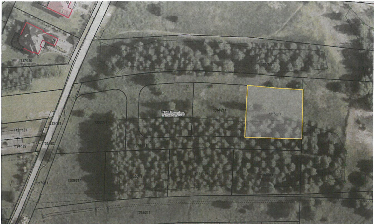
Rysunek 1 Działka nr 1315/211 przeznaczona do sprzedaży zaznaczona kolorem żółtym