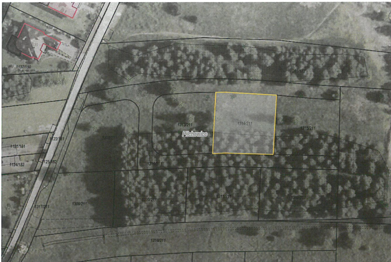
Rysunek 1 Działka nr 1314/211 przeznaczona do sprzedaży zaznaczona kolorem żółtym