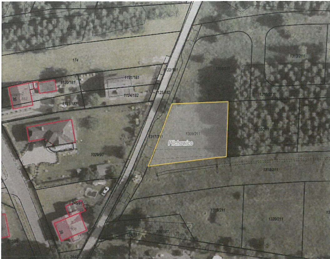
Rysunek 1 Działka nr 1309/211 przeznaczona do sprzedaży zaznaczona kolorem żółtym