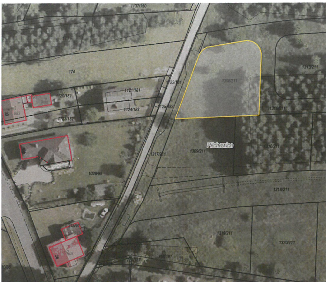
Rysunek 1 Działka nr 1308/211 przeznaczona do sprzedaży zaznaczona kolorem żółtym