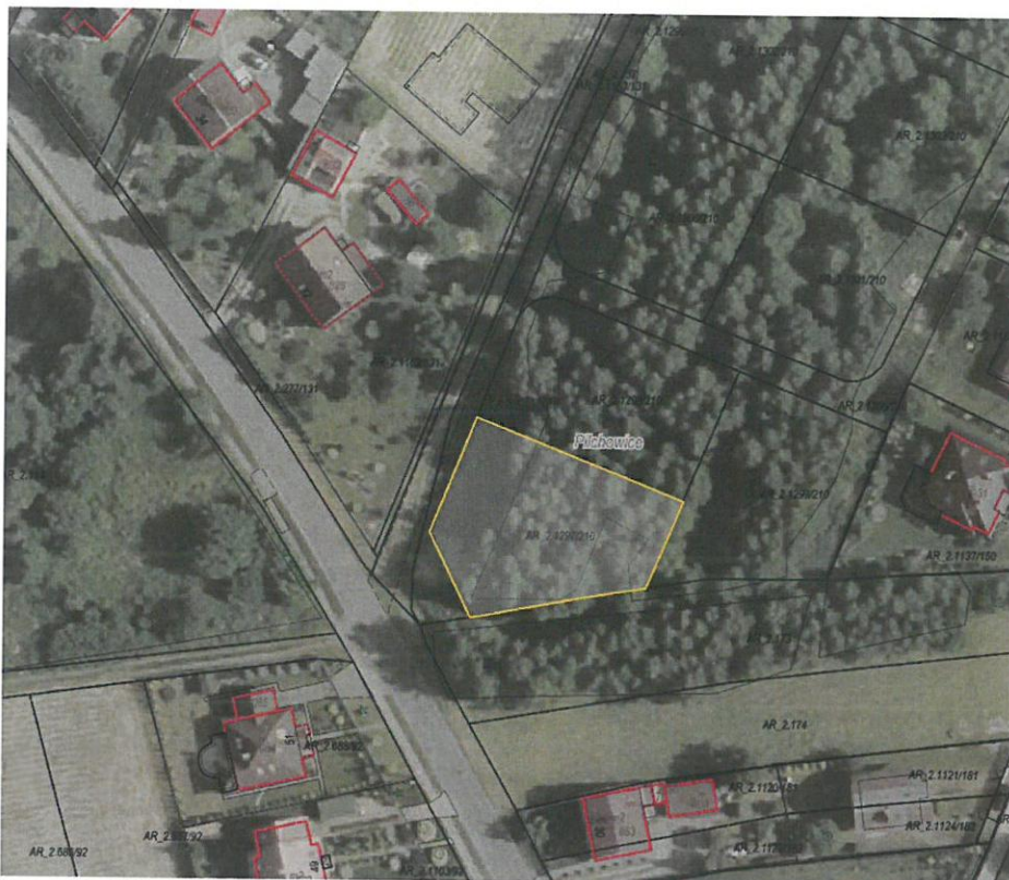
Rysunek 1 Działka nr 1297/210 przeznaczona do sprzedaży zaznaczona kolorem żółtym

Dla przedmiotowej działki objętej sprzedażą nie wykonano badań geotechnicznych, ani badań stopnia zanieczyszczenia gleby. Zatem sprzedawca nie ponosi odpowiedzialności za ewentualne negatywne skutki wyników tych badań.