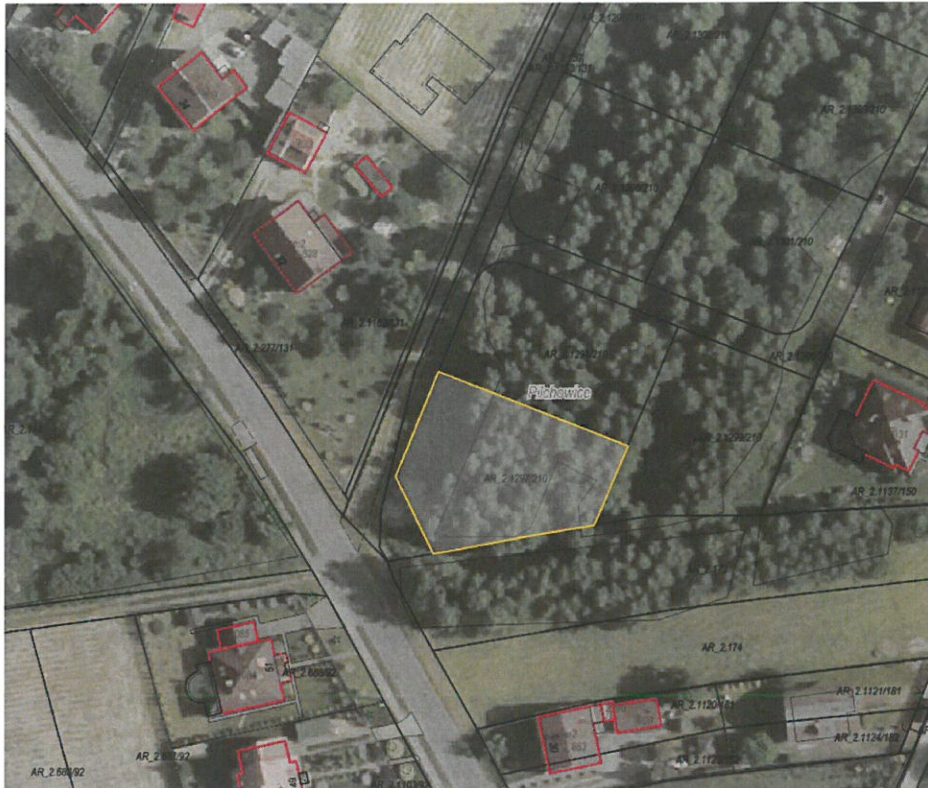
Rysunek 1 Działka nr 1297/210 przeznaczona do sprzedaży zaznaczona kolorem żółtym

Dla przedmiotowej działki objętej sprzedażą nie wykonano badań geotechnicznych, ani badań stopnia zanieczyszczenia gleby. Zatem sprzedawca nie ponosi odpowiedzialności za ewentualne negatywne skutki wyników tych badań.