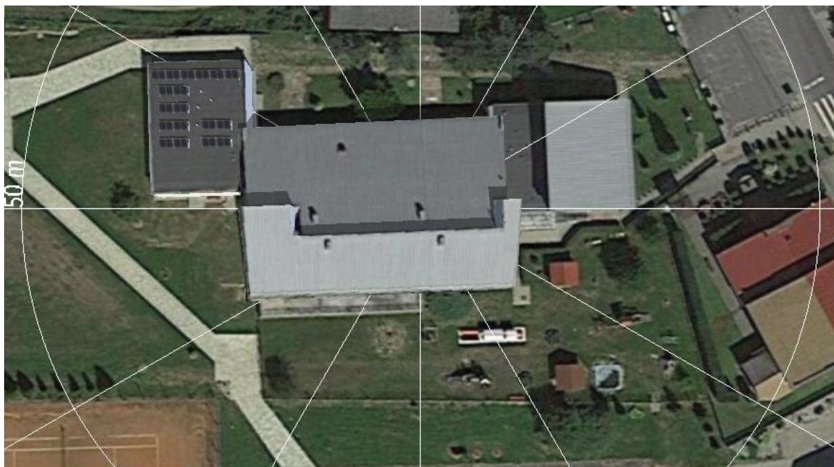
Fotografia 4. Proponowane rozmieszczenie modułów PV na dachu budynku – instalacja II o mocy min. 7,29 kWp