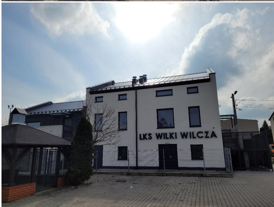
Fotografia 2. LKS „Wilki” Wilcza