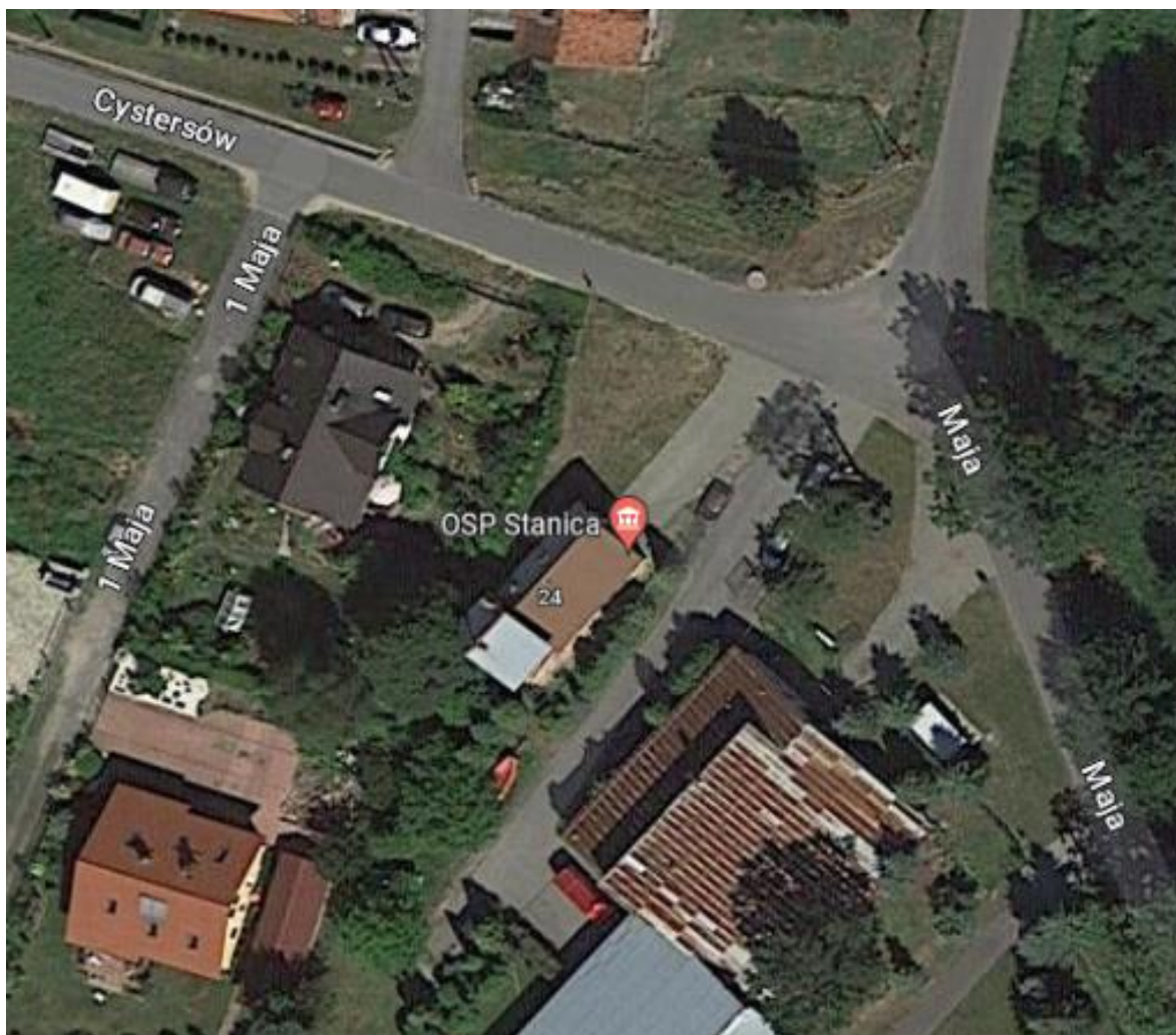
Fotografia 1. Lokalizacja inwestycji – OSP Stanica

województwo śląskie powiat gliwicki gmina Pilchowice adres: ul. 1 Maja 24a, 44-145 Stanica nr działki, obręb 394/58, 0006 Stanica