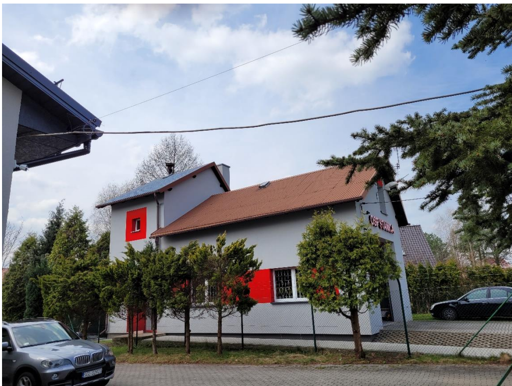
Fotografia 2. OSP Stanica