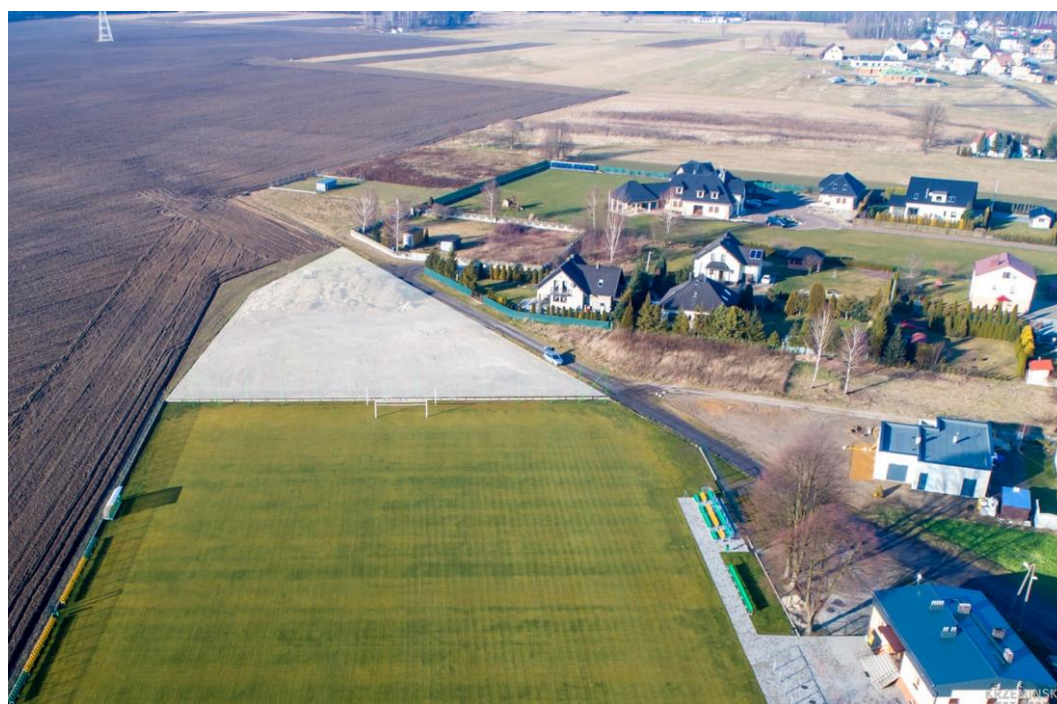
Fotografia 1. Lokalizację inwestycji – Przedszkole w Stanicy