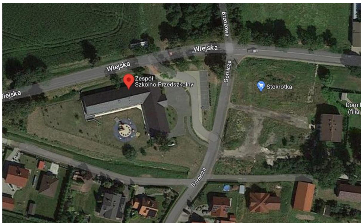
Fotografia 1. Lokalizację inwestycji – Zespół Szkolno-Przedszkolny w Żernicy

województwo śląskie powiat gliwicki gmina Pilchowice adres: ul.Górnicza 2m, 44-144 Żernica nr działki, obręb 812/8, 0008 Żernica