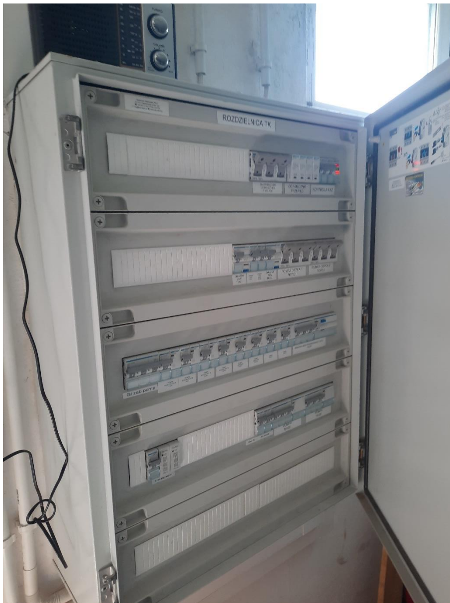
Fotografia 2. Publiczne Przedszkole z Oddziałem Integracyjnym w Nieborowicach