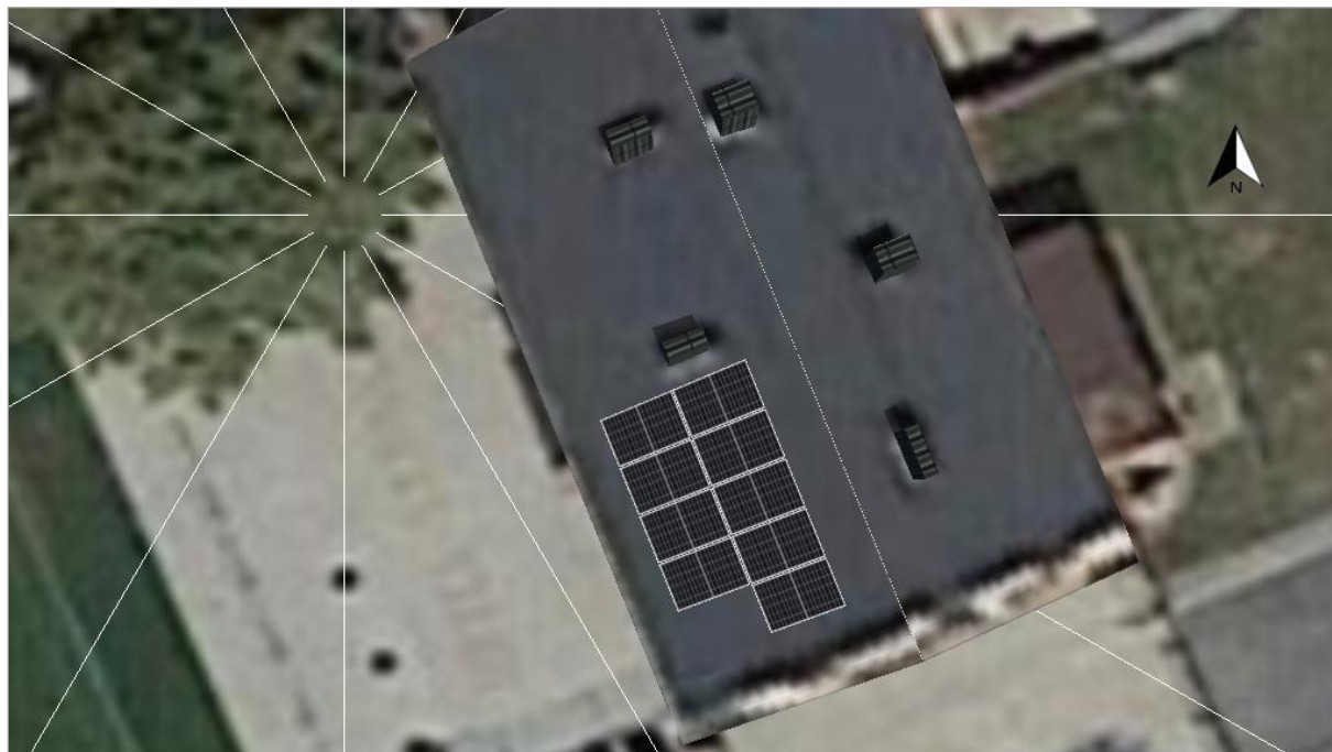
Fotografia 3. Proponowane rozmieszczenie modułów PV na dachu budynku

Proponowane rozmieszczenie modułów PV na dachu budynku