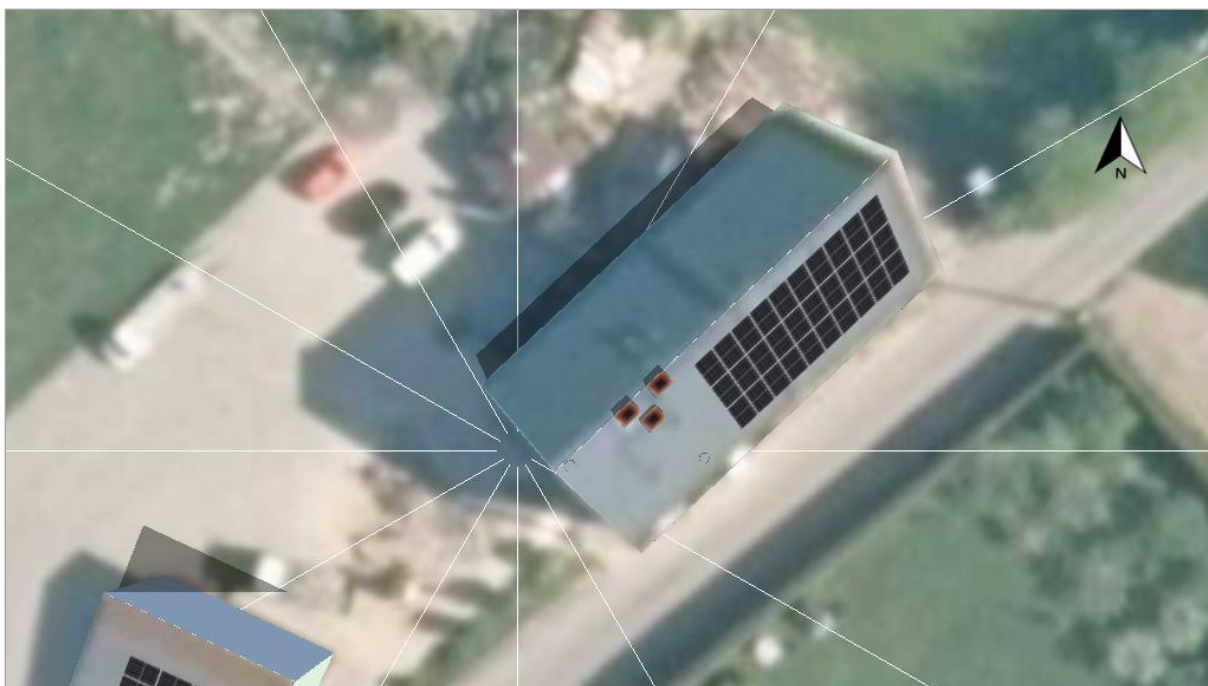
Fotografia 3. Proponowane rozmieszczenie modułów PV na dachu budynku