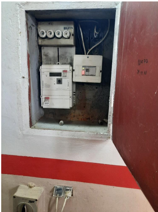
Fotografia 2, 2. LKS „Orzeł” Stanica