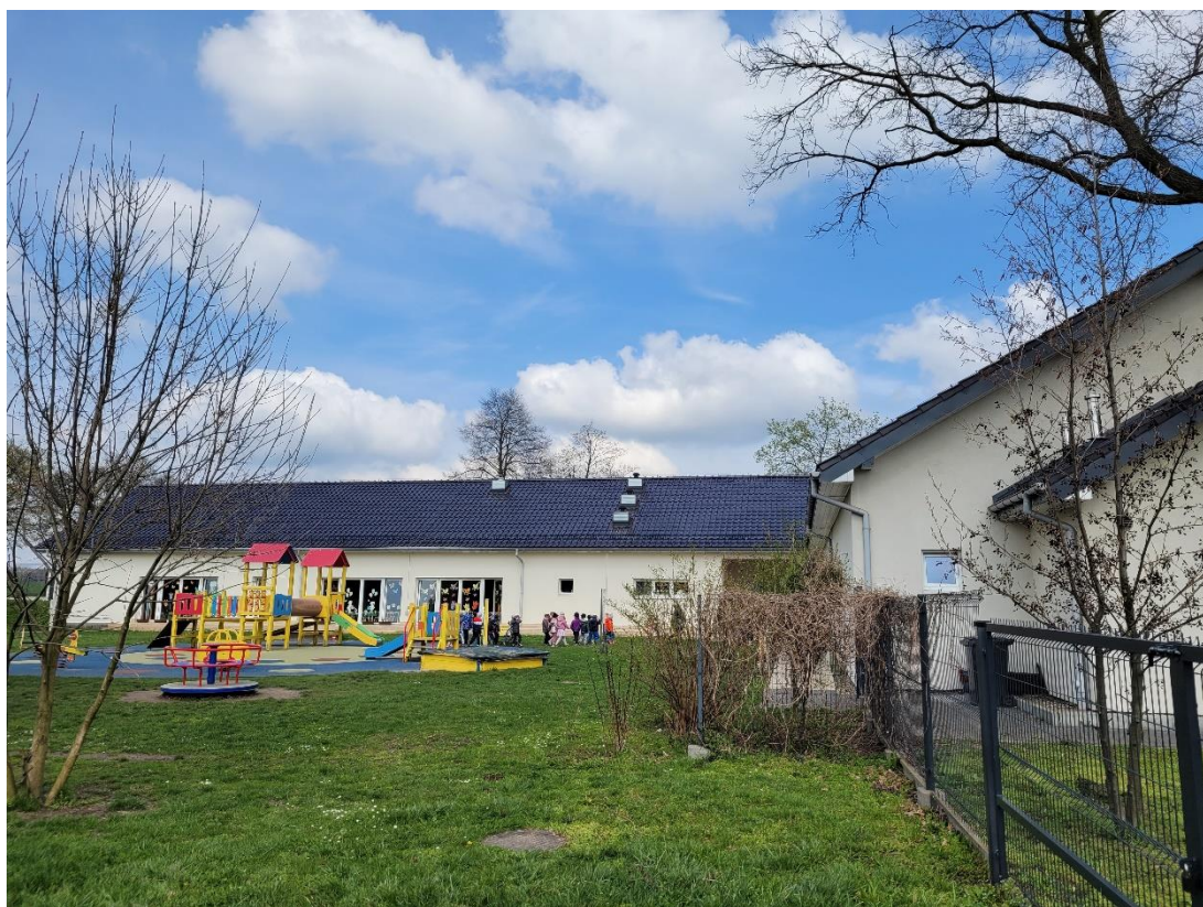
Fotografia 2. Zespół Szkolno-Przedszkolny w Żernicy