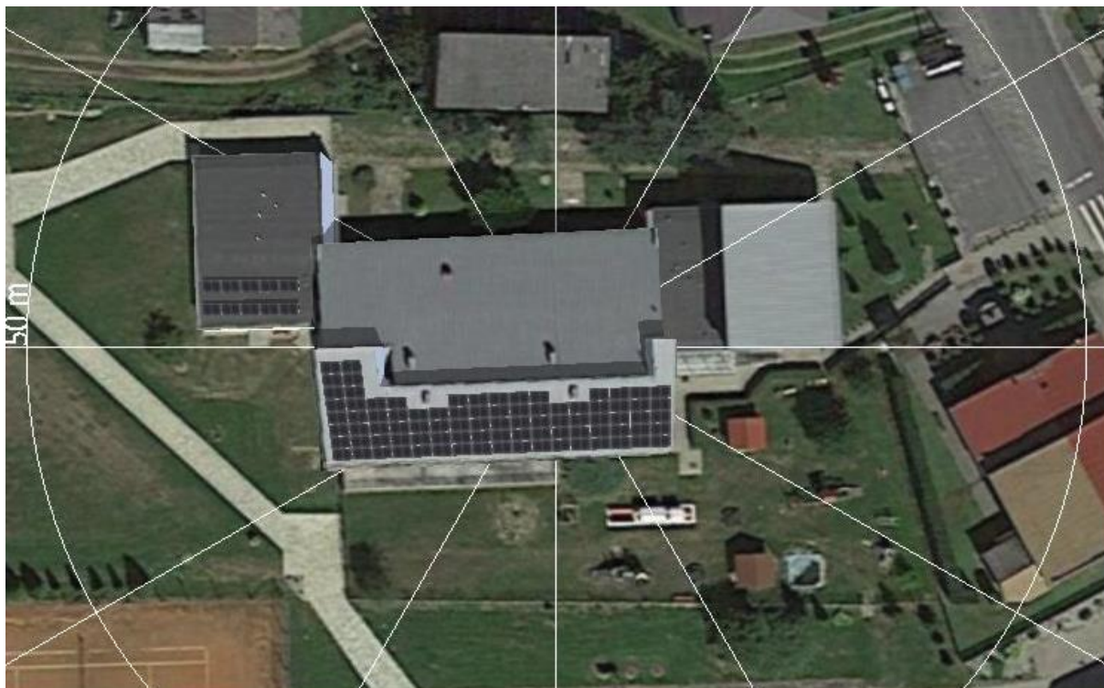
Fotografia 3. Proponowane rozmieszczenie modułów PV na dachu budynku – instalacja I o mocy min. 39,29 kWp

Proponowane rozmieszczenie modułów PV na dachu budynku