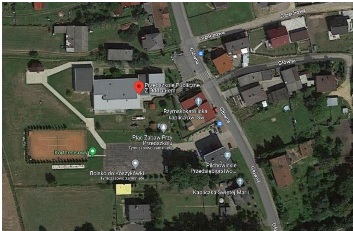
Fotografia 1. Lokalizację inwestycji – Przedszkole w Nieborowicach

województwo śląskie powiat gliwicki gmina Pilchowice adres: ul.Główna 50, 44-144 Nieborowice nr działki, obręb 934/97, 0003 Nieborowice