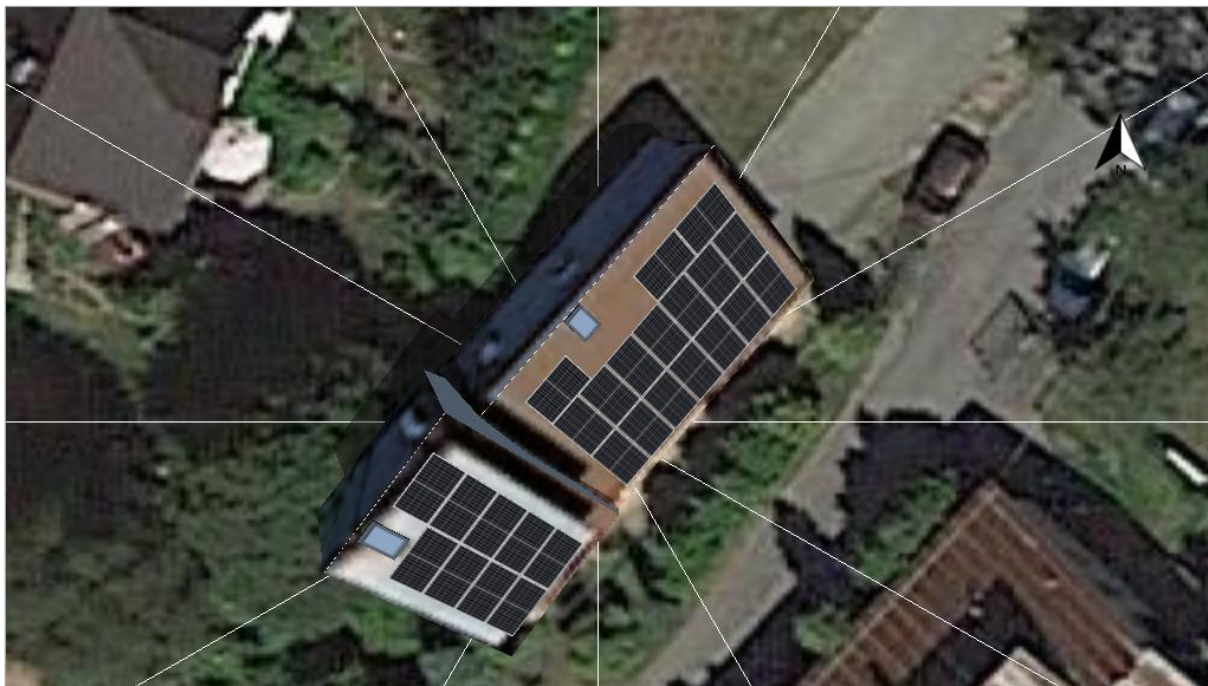
Fotografia 3. Proponowane rozmieszczenie modułów PV na dachu budynku

Proponowane rozmieszczenie modułów PV na dachu budynku