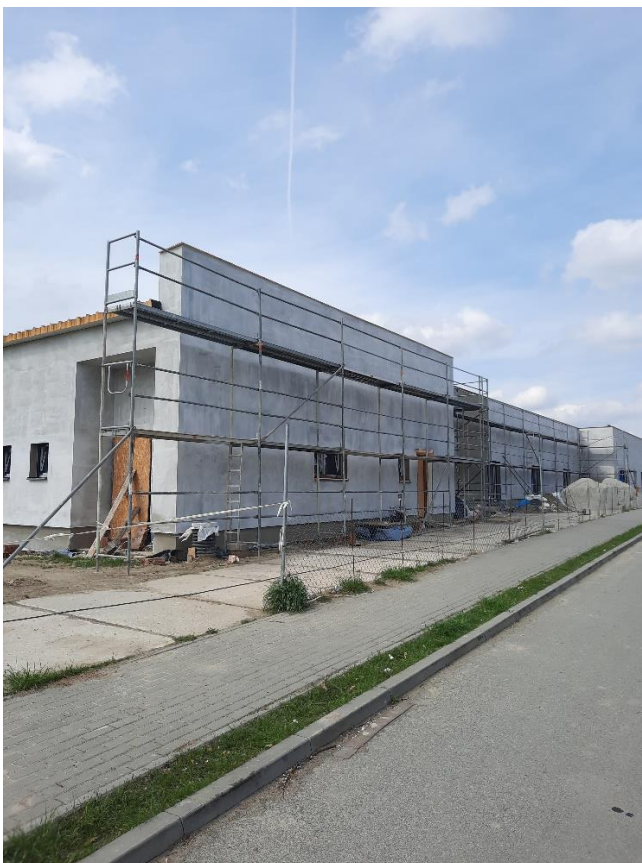
Fotografia 2. Przedszkole w Stanicy